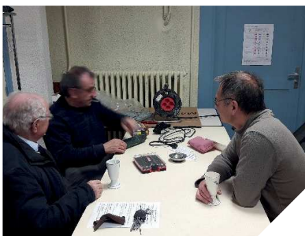
Cafés, bricolage et... bavardages

Le temps incertain a poussé l'équipe du Café Réparation à organiser cette nouvelle édition dans les salles du Lavoir. Cette « délocalisation » n'a pas eu d'impact négatif sur la fréquentation, bien au contraire les nombreuses personnes venues réparer leurs matériels défectueux avec les bricoleurs bénévoles du café réparation ont été très heureuses de s'installer « au chaud » pour démonter leurs appareils tout en dégustant café, thé et pâtisseries (merci à nos cuisinières). Au total ce sont plus de 18 objets qui ont été diagnostiqués représentant 47 kg. 8 équipements ont été remis en état de marche, 15 kg de déchets évités. Pour 8 autres objets la panne a pu être diagnostiquée ; les réparations sont possibles en remplaçant les pièces défectueuses ; encore 30 kg potentiellement sauvés de la poubelle. 2 appareils électroménagers ont été jugés irréparables ; 1,8 kg de matériel qui devra être déposé à la déchèterie pour être recyclé. 6 réparateurs ont participé à ces diagnostics et réparations ; 3 sympathiques « hôtesse » ont accueilli et renseigné les visiteurs.