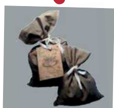
Atelier Fleur de bouses

Rendez-vous de 9h à 12h Place des Cadettes