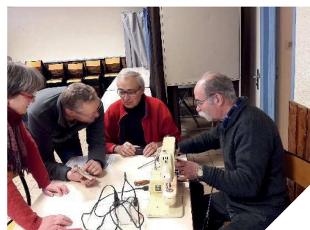
Une équipe de bénévoles en plein travail