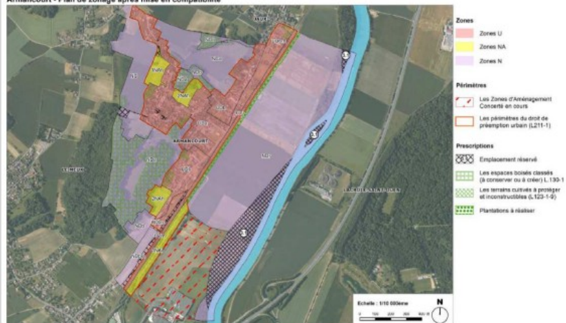
Armancourt - Plan de zonage après mise en compatibilité

Le projet prévoit le creusement de la nouvelle Oise dans la plaine agricole, en bleu clair sur la carte.