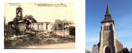
Eglise de Bouchavesnes : hier et aujourd'hui

JMO Le « journal de marches et opérations » d'un régiment (JMO) est le document « mémoire » du régiment. Tenu au jour le jour, il doit comporter les informations concernant les données suivantes : effectif au jour du départ ; mise en route ; bivouac ou cantonnements ; reconnaissance ; combats ; pertes ; récompenses ; actions d'éclat ; situations. Le département de l'armée de Terre du Service historique de la Défense (SHD) conserve 18 453 journaux de marches couvrant la Première Guerre mondiale qui sont consultables sur le site : http://www.memoiredeshommes.sga.defense.gouv.fr/fr/spip.php?rubrique16