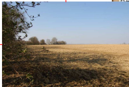
Emplacement actuel de la Ferme du Bois Labé (vu de la cote 771)