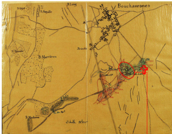
Carte du secteur de Bouchavesnes à partir du 18 octobre 1916