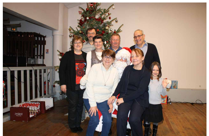
Le Noël des enfants