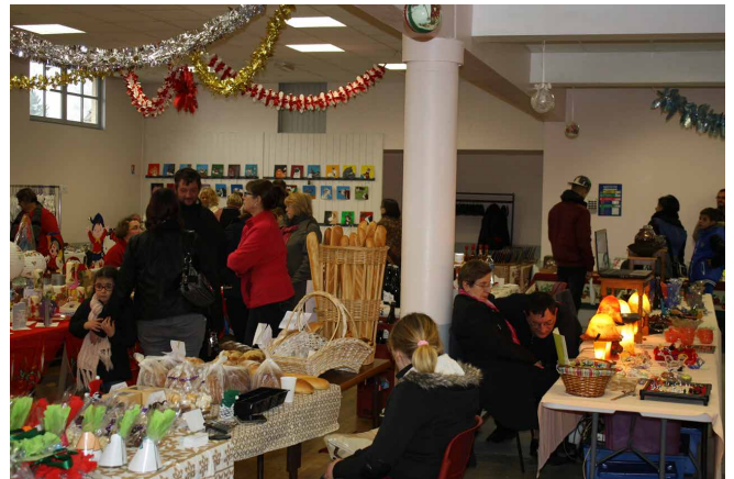
Le marché de Noël