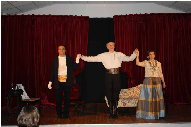
Le Théâtre de l'Orage et les enfants