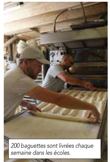
200 baguettes sont livrées chaque semaine dans les écoles.