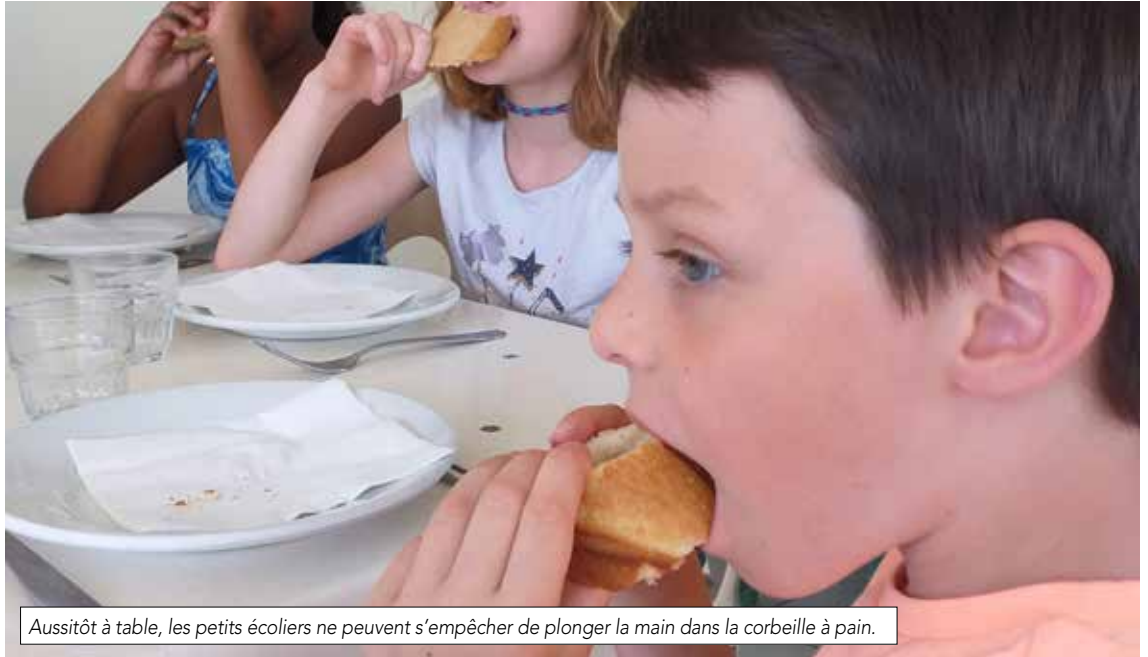
Aussitôt à table, les petits écoliers ne peuvent s'empêcher de plonger la main dans la corbeille à pain.

À une époque pas si éloignée, le pain constituait l'aliment de base de notre alimentation. Aujourd'hui, la diversité des pains tend à relancer sa consommation et le Français apprécie de plus en plus le bon pain de son boulanger. Nos écoliers aussi.