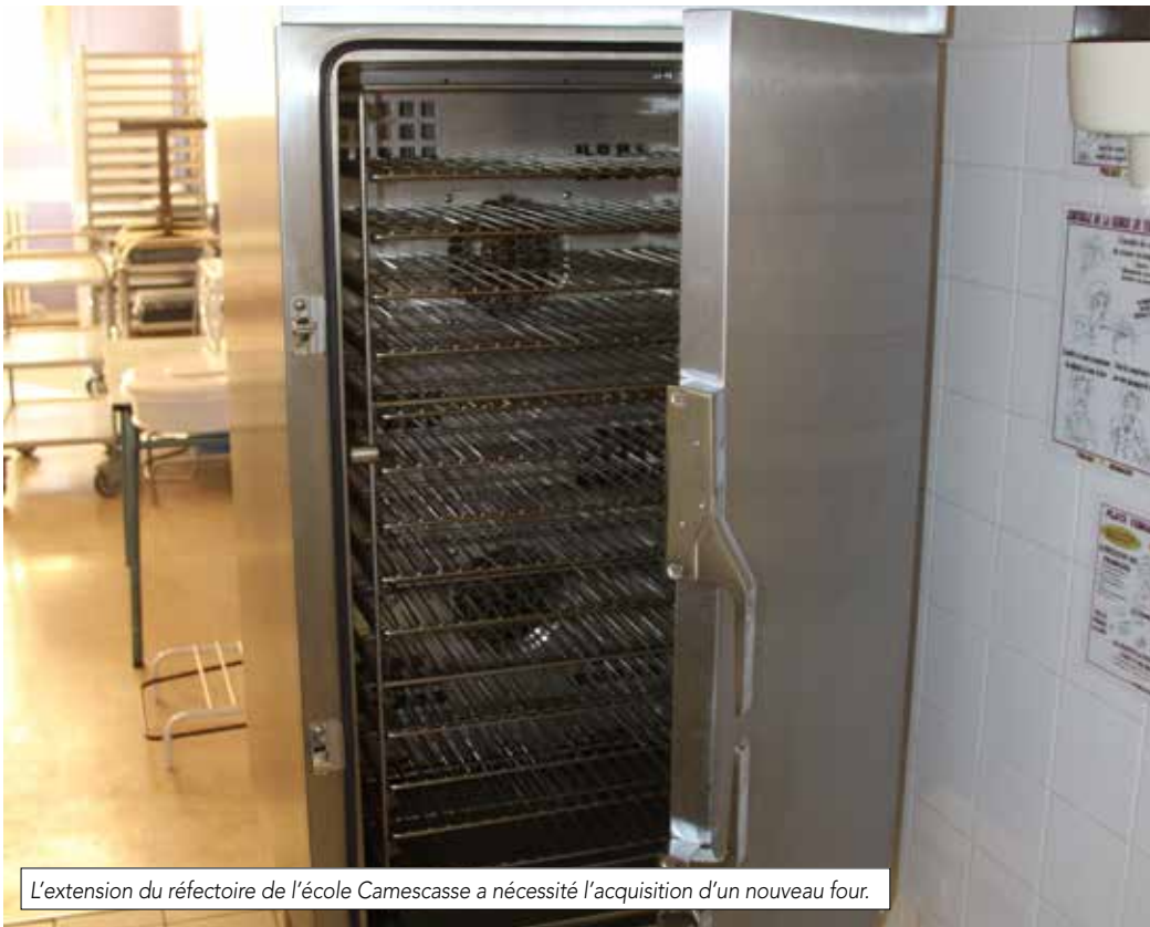
L'extension du réfectoire de l'école Camescasse a nécessité l'acquisition d'un nouveau four.

instituteurs afin d'utiliser sa salle de classe en réfectoire pour accueillir davantage de demi-pensionnaires. La salle des instituteurs a été déplacée dans l'ancienne classe de Mme Mendel, qui réintègre sa classe initiale entièrement rénovée du sol au plafond.