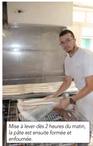
Mise à lever dès 2 heures du matin, la pâte est ensuite formée et enfournée.

Bonne rentrée à nos petits écoliers et bon appétit.