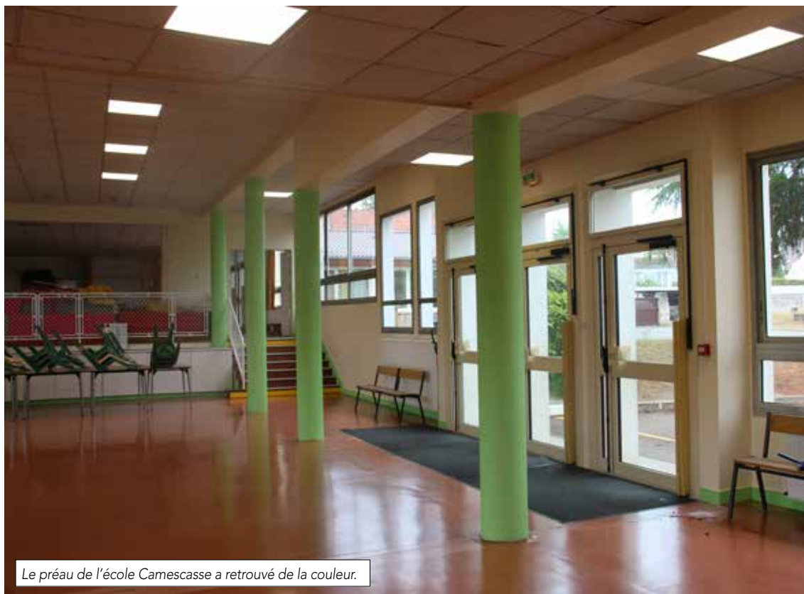
Le préau de l'école Camescasse a retrouvé de la couleur.