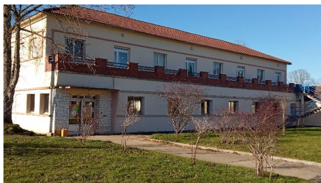
Centre Afpa Le Vigeant

Afpa Le Chaffaud 86150 LE VIGEANT 09.72.72.39.36 www.afpa.fr