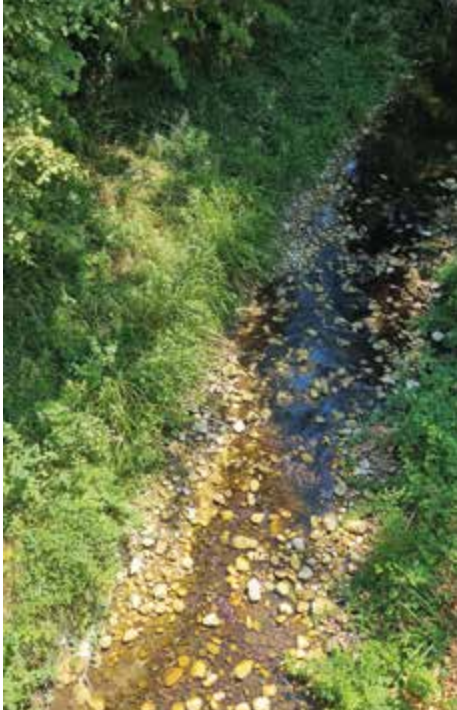
Photo (SIEBRC) prise au niveau du pont sur la RD126 le 10 août 2022, route d'Espeluche à Puygiron.

La Citelle coule avec un petit filet d'eau que nous devons laisser passer