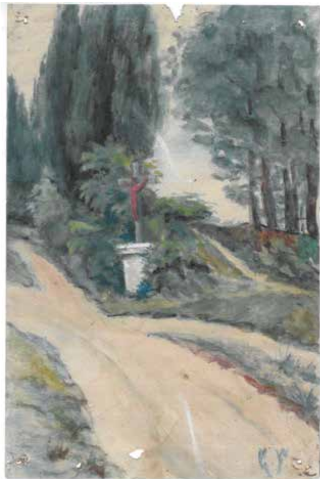
Document inédit : Aquarelle de la croix des missions (1913) à l'angle du chemin des Échaunes.

Les activités de l'association reprendront courant septembre. Nous avons pour projet l'édition qu'un troisième livre intitulé « la chapelle Saint Blaise » ainsi qu'une veillée historique.