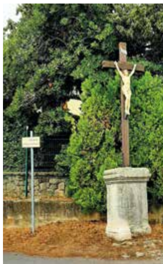
Vue actuelle de la Croix des Missions

Yvon Benetreau 25 chemin des Chênes 26740 Montboucher-sur-Jabron Tél : 04 75 04 15 58