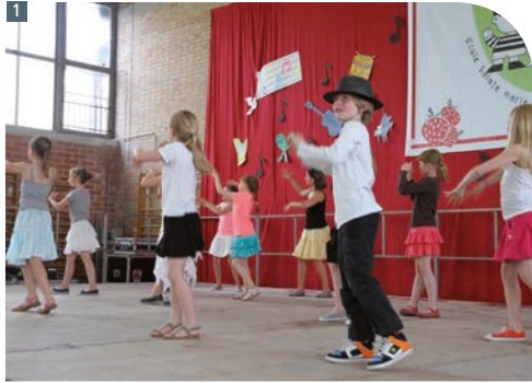
1 Spectacle CE2-CM1