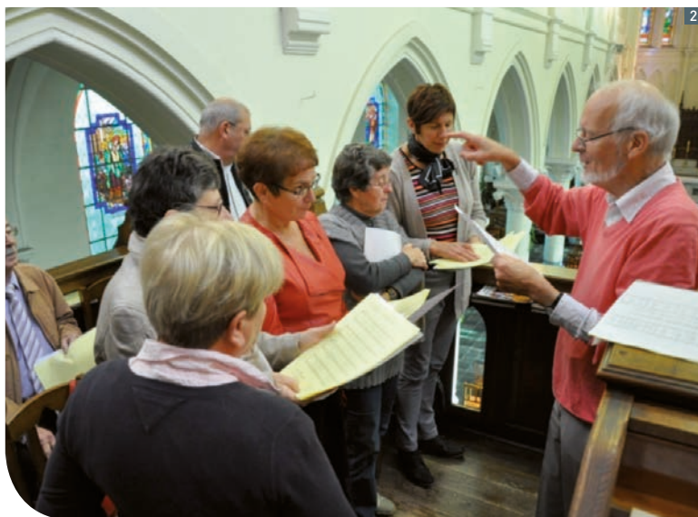
1 Les choristes, conjoints et sympathisants lors de la Sainte-Cécile, le 23/11/2014