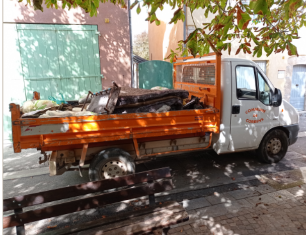
Une benne bien remplie lors de la journée de nettoyage "World Clean Up". (18 septembre 2021)