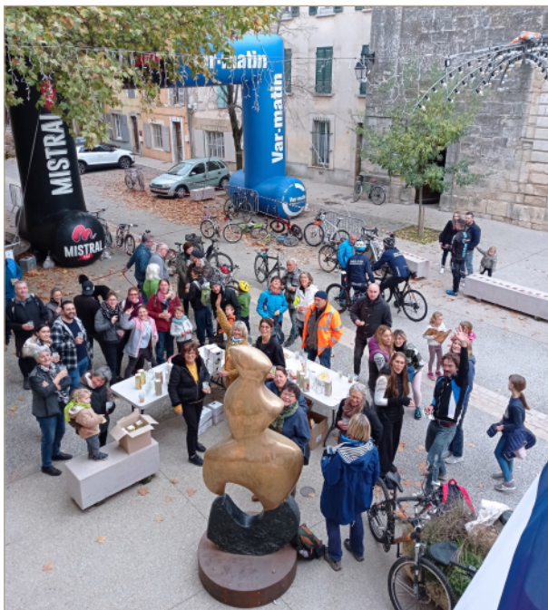
Un petit verre bien mérité au retour de la balade verte à vélo. (22 novembre 2021)

Page suivante : un grand élan de solidarité des Corrensois pour les Ukrainiens (mars 2022)