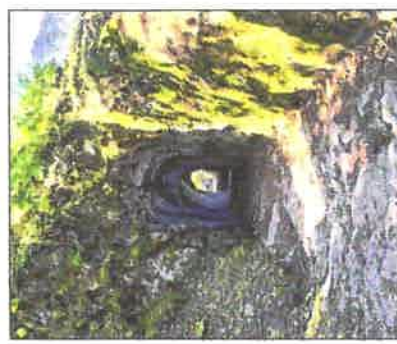
Au château de Wildenstein, un surprenant tunnel creusé à même la roche.

PLUS WEB Diaporama et vidéo sur nos sites dna.fr et lalsace.fr