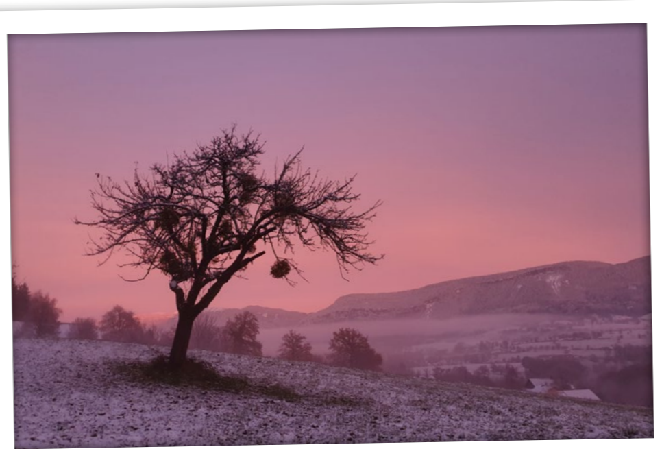
5 décembre 2020