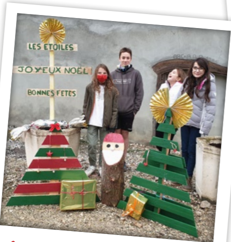
Avec de la récup' et des idées...