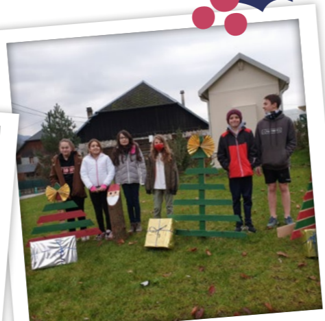
...les jeunes ont créé de belles décorations de Noël !

À savoir : si tu as entre 11-15 ans et que tu veux participer aux prochaines activités, tu peux contacter Josette Arseguel au : 06 74 38 48 83