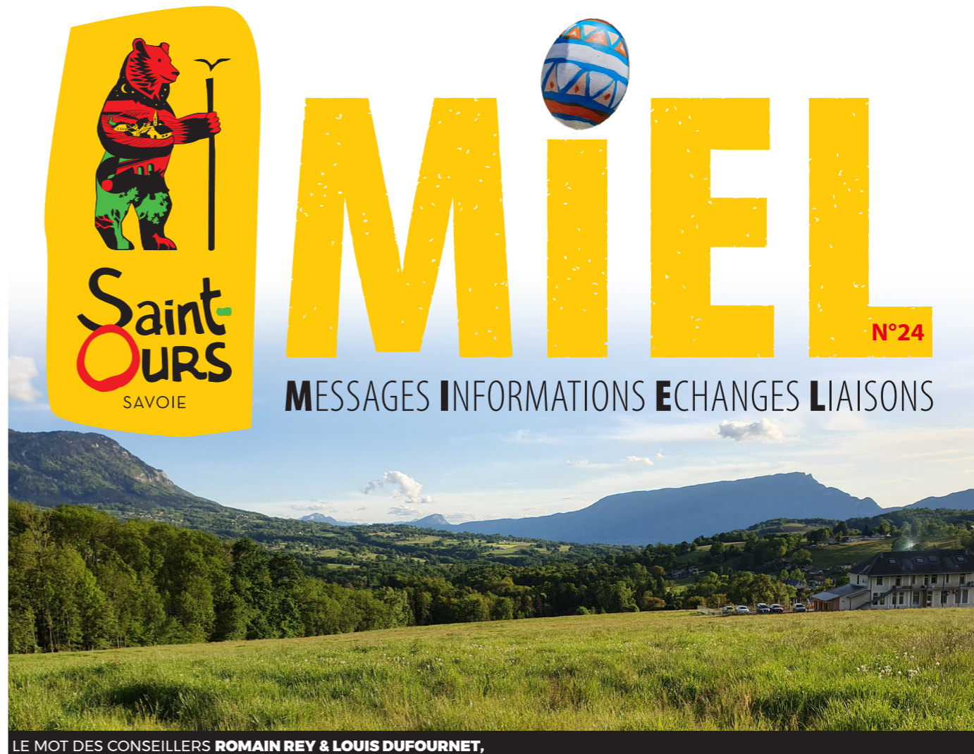
LE MOT DES CONSEILLERS ROMAIN REY & LOUIS DUFOURNET,

Envoyez-nous les photos de notre village ! communication@saintours-savoie.fr