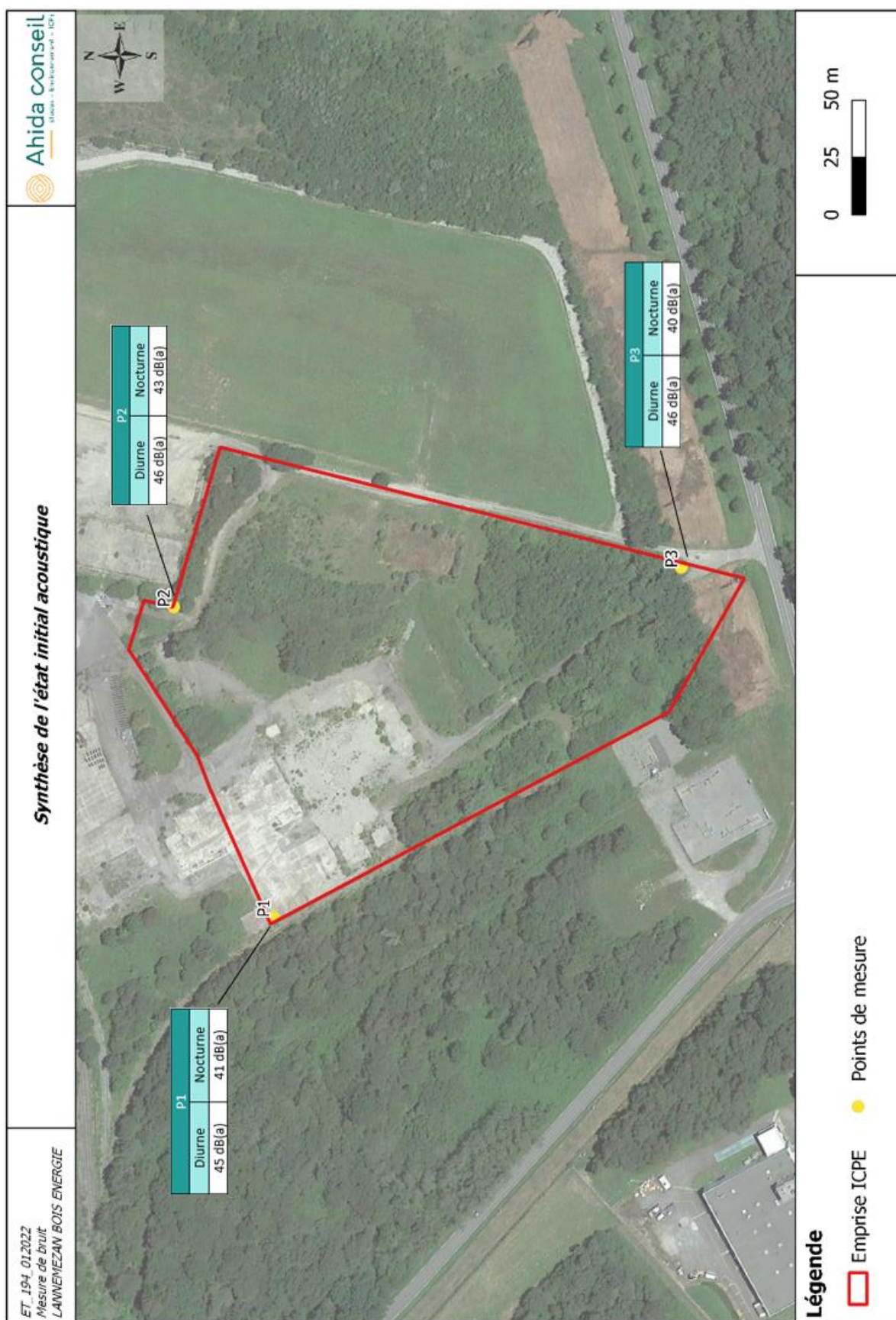
Figure 1 : Synthèse de l'état initial acoustique de l'environnement