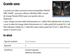
UN ANNUAIRE DU MATÉRIEL