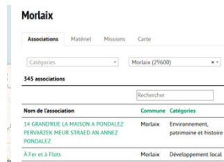
UN ANNUAIRE DES ASSOCIATIONS