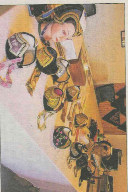
Les coiffes tarines.

enfoui dans le passé qui se dressent ainsi devant nous.