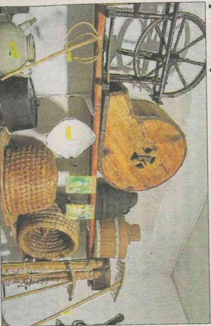
Quelques vieux objets savoyards.