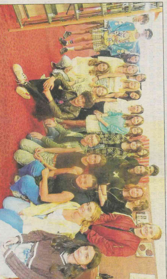
Ces vingt-sept élèves d'une classe de seconde, accompagnés par leur enseignant, ont découvert le CDI mardi matin.