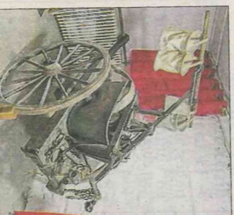
Une pompe à incendie ayant servi à la fin du XIX e et au début du XX e siècles.