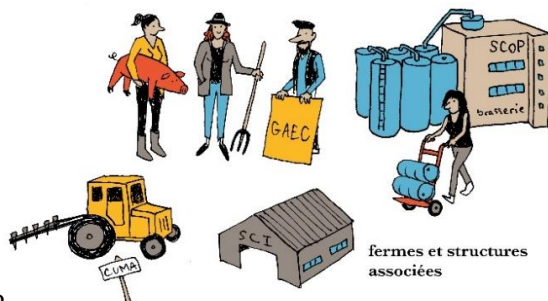
fermes et structures associées