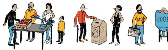
partenaires techniques et économiques