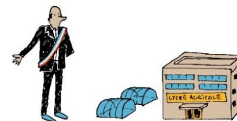
collectivités et établissements publics