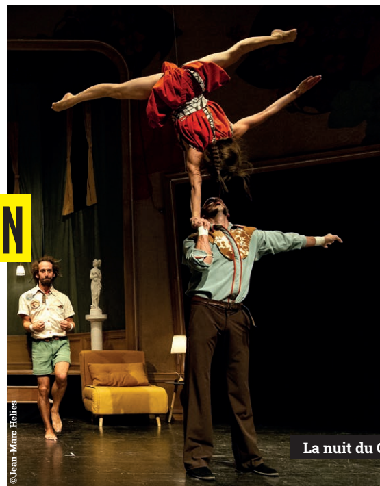
La nuit du Cerf

Cette année encore, place à la diversité : soyez curieux et laissez-vous tenter par une programmation riche et variée, à deux pas de chez vous, à des tarifs très attractifs. Toutes les conditions sont mises en place pour accueillir artistes et public en toute sérénité.