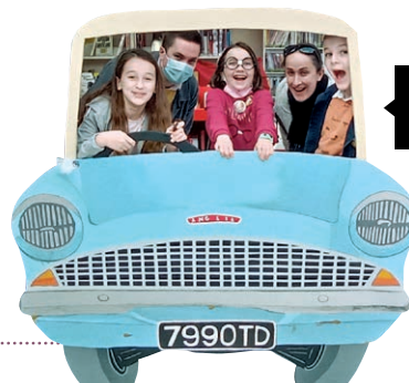
Harry Potter à la bibliothèque

Ateliers, heure du conte, escape game : tous les moyens sont réunis pour permettre à chacun de passer des bons moments à la bibliothèque. Le succès des animations autour de l'univers du magicien Harry Potter a été un parfait avant-goût des fameuses "Journées Geek" qui se dérouleront pour la 2 e fois au Vallon les 21 et 22 mai. Un moment à ne surtout pas rater pour les passionnés (et les curieux !) de pop culture ! ■