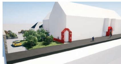
▲ Un signal d'appel depuis la rue du Général de Gaulle : rappel de l'identité de la médiathèque mémorisée dans la mémoire collective.

Le cabinet a proposé un ensemble d'intentions qui ont toutes été accueillies très favorablement, tant par les professionnels concernés que par les élus lors de la présentation du projet en commission municipale le 24 avril dernier.