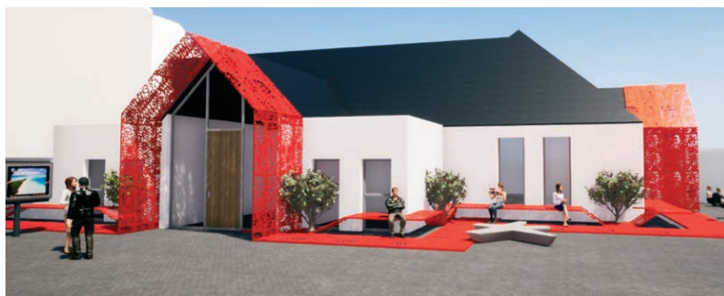
▲ Poursuivre sur le parvis intérieur l'appel lancé depuis la rue du Général de Gaulle.