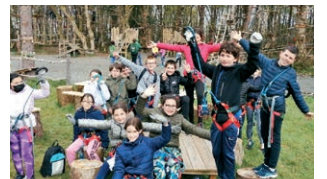
Sortie à l'accrobranche de Dirinon pour le Local Jeunes