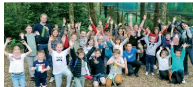
Sortie au domaine du Treuscoat (filets dans les arbres)

Les enfants ont aussi bénéficié de sorties sportives. Entre défouloir et nature, ils ont tous été comblés. ■