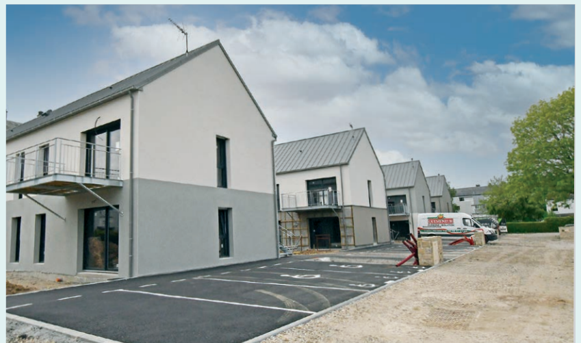
Les 24 logements sur l'ancien site de l'école de Kervignounen sont en cours de finition. ▲

Deux bâtiments (rez-de-chaussée + deux étages desservis par ascenseur) seront construits avec le souci de conserver une grande partie des buttes et des arbres existants et d'ouvrir les séjours sur des orientations Est, Sud ou Sud-Ouest.