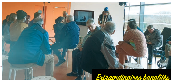
Extraordinaires banalités Les résidents de la maison Saint-Michel de Kervoannec (Plougourvest) au Vallon

D iversité, accessibilité, parité : il y a dans la programmation culturelle de la Ville, que ce soit au Vallon, à l'espace Lucien-Prigent ou à la Bibliothèque Xavier-Grall, un véritable engagement à porter ces valeurs, en direction de tous les publics, vraiment tous ! Zoom sur quelques partenariats confirmant pleinement les valeurs d'égalité et de partage portées par la municipalité.