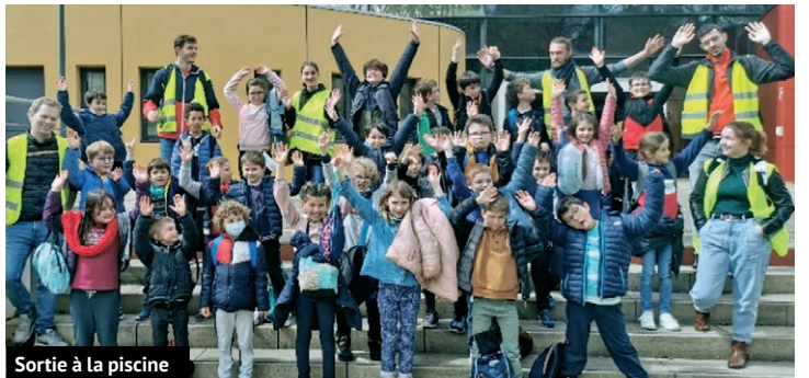
Sortie à la piscine