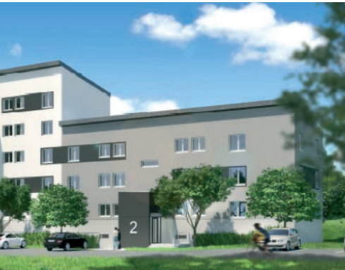
Création de trois cages d'ascenseur ▲ sur les R+4 du bâtiment 2