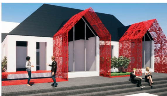
▲ Garder et détourner les traits identitaires de la médiathèque existante.