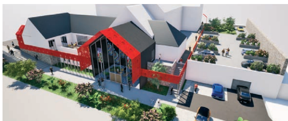
▲ Créer des liaisons piétonnes et désenclaver la médiathèque.