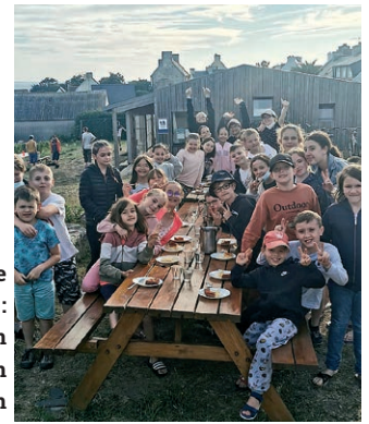
Séjour île de Batz 2022 : Bicycl'action Equit'action Ça tourn'action

Au menu, des sorties hebdomadaires de découvertes ou de sensations, des grands jeux collectifs, des animations manuelles de confection, du sport et plein d'autres activités ! De quoi faire passer aux enfants deux mois de vacances plongés dans le divertissement. ■