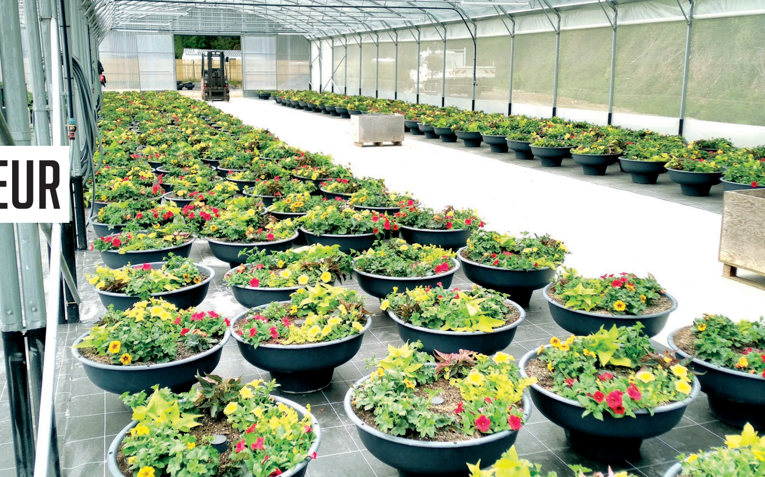
Préparation des suspensions en serre ▲