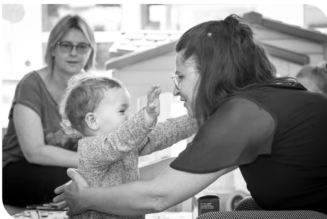
Exposition de photos en noir et blanc d'Angélique BUISSON

Cette exposition de photos, en noir et blanc, met en valeur le lien entre les assistantes maternelles et les enfants. Elle est visible jusqu'au 21 octobre 2022 dans la galerie de la MAPEJE avant de suivre un parcours itinérant sur plusieurs lieux de St Nicolas de Port puis dans les communes de la Communauté de Communes des Pays du Sel et du Vermois.