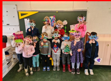
Réalisation du périroilaire maternelle