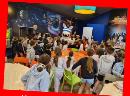
Voyage au Futuroscope