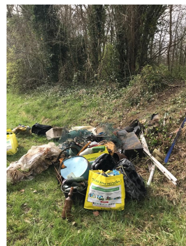
Triste collecte !!

Maxime LABELLE et la municipalité adressent un grand merci aux acteurs présents et au SMETOM de la Vallée du Loing pour la mise à disposition des gants, sacs et pinces.