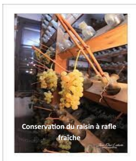
Conservation du raisin à rafle fraîche

Les vignes ne font plus partie de notre paysage. Cependant il existe une volonté de préserver ce patrimoine viticole dans la région. Dans cet esprit, la commune de Moncourt-Fromonville a replanté il y a quelques temps des ceps de vigne le long du mur situé vers la salle polyvalente devenu salle de La Treille.