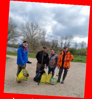
Journée ramassage des déchets