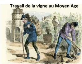
Travail de la vigne au Moyen Age

La qualité des produits se maintint au cours de