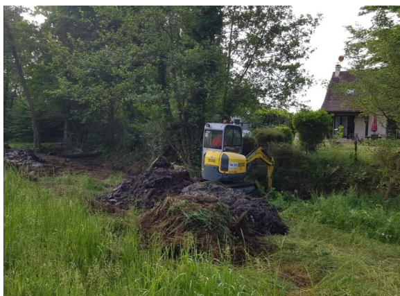
Contre fossé chemin de halage