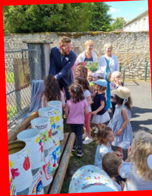
Les poubelles à mégots

Imprimé par Réseau 45 en 940 exemplaires