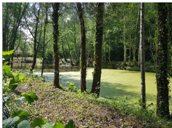
Bassin de rétention