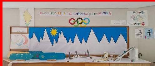
Réalisation du périroilaire élémentaire