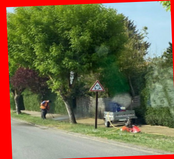
Nettoyage des trottoirs