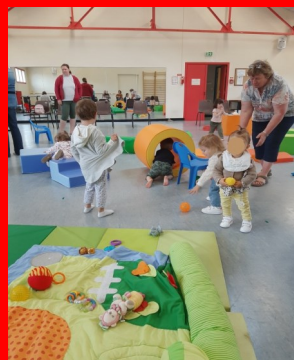
Relais Petite Enfance