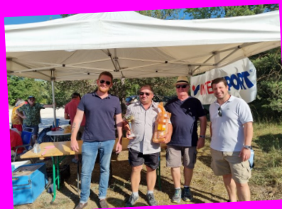
Tournoi de pétanque du 14 juillet