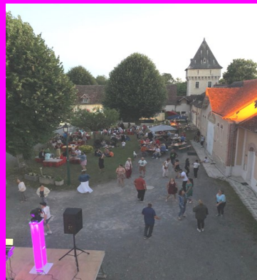
Soirée des éphémères