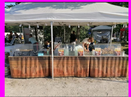
Festivités du 14 juillet