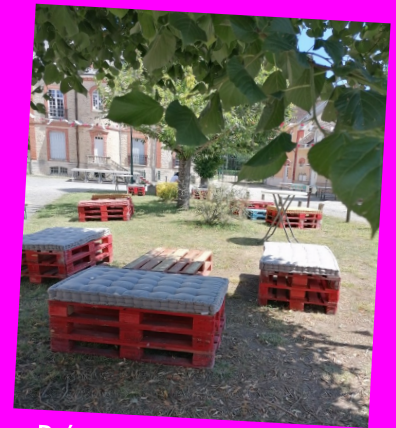
Préparatifs des éphémères