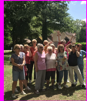
Gymnastique douce parc du château