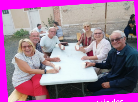
Les fidèles Moncourtois des Ephémères