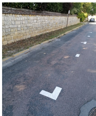
Marquage au sol de la rue grande