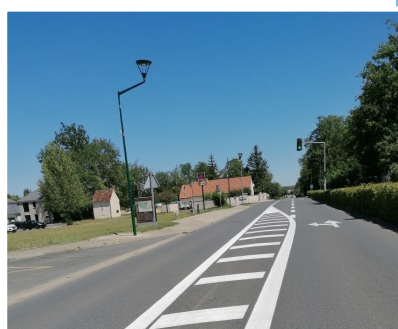
Réfection de la peinture routière route de Moret

Les candélabres du parc des Rougemonts ont également changé d'apparence avec l'application d'une peinture noire.