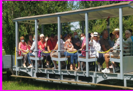
Sortie des séniors au tacot du lac

Imprimé par Réseau 45 en 940 exemplaires