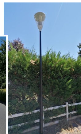
Peinture des candélabres