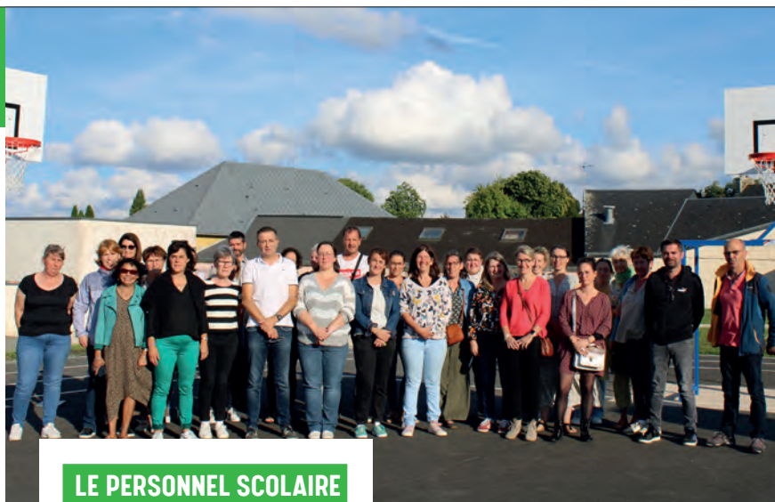
LE PERSONNEL SCOLAIRE