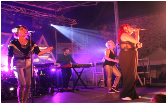
Festilac #3 5/08/2022