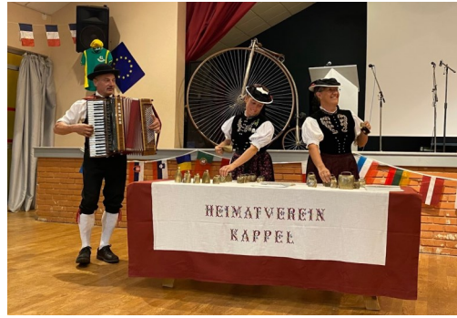
Semaine jumelage 19/08 au 26/08/2022