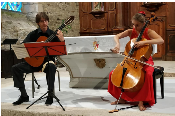
Soirée Sevoy 27/08/2022