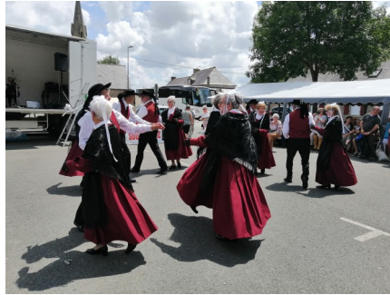
Fête de l'amitié 23/06/2022