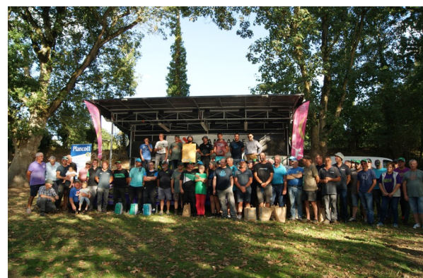
Marathon de la pêche 10 et 11/09/2022