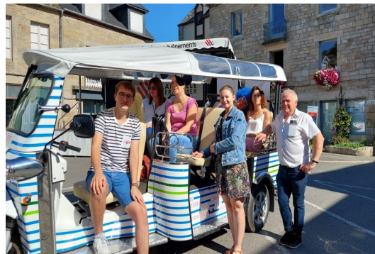
Journée Village Etape 09/07/2022