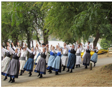
Fête folklorique 15/08/2022