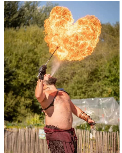
Marché médiéval 6-7/08/2022