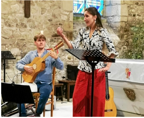
Soirée Sevoy 04/06/2022