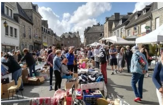
Vide grenier 04/09/2022