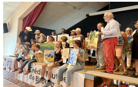
Couleurs de Bretagne 15/08/2022