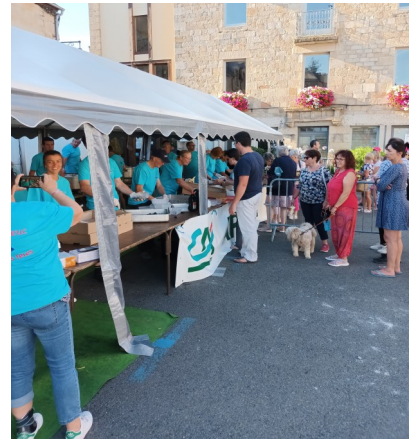
Repas moules frites 14/07/2022