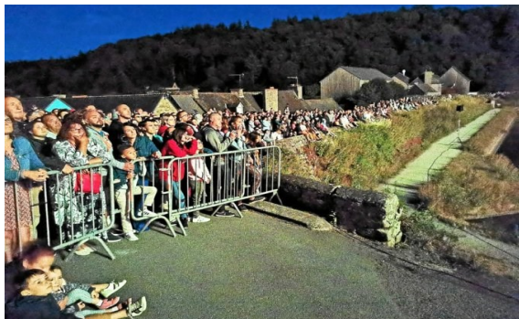
Feu d'artifice 14/07/2022