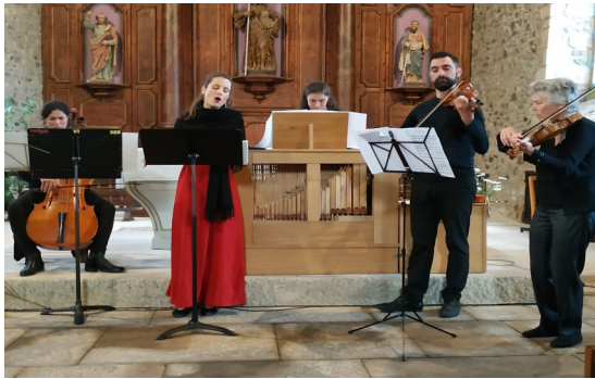
Soirée Sevoy 25/06/2022