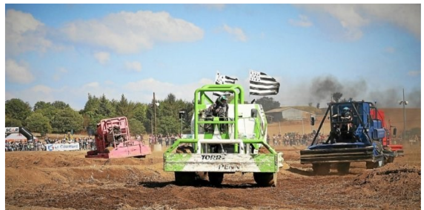
Terre Attitude 27-28/08/2022