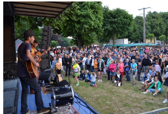
Fête de la musique 21/06/2022