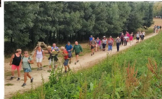
Randonnée gourmande 21/08/2022