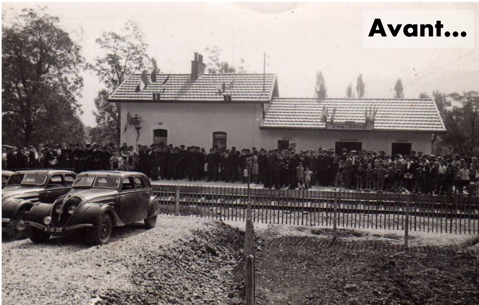
1949: inauguration de la gare de Fréterive