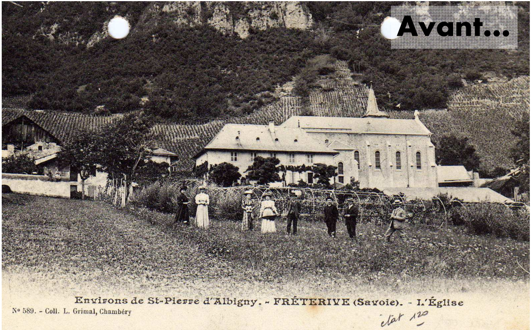
Environs de St-Pierre d'Albigny. - FRÉTERIVE (Savoie). - L'Église N° 589.