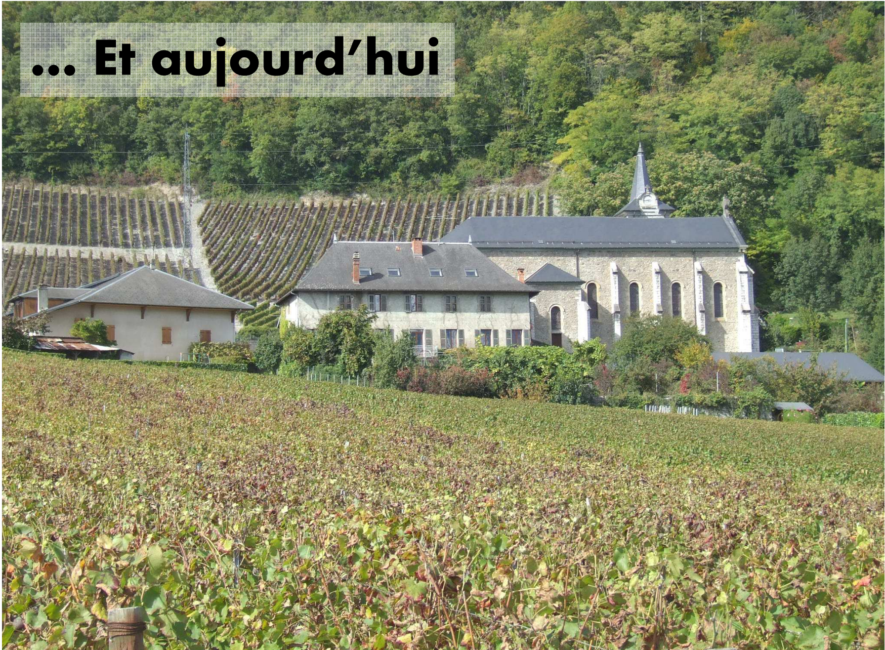
L'église et le préventorium aujourd'hui