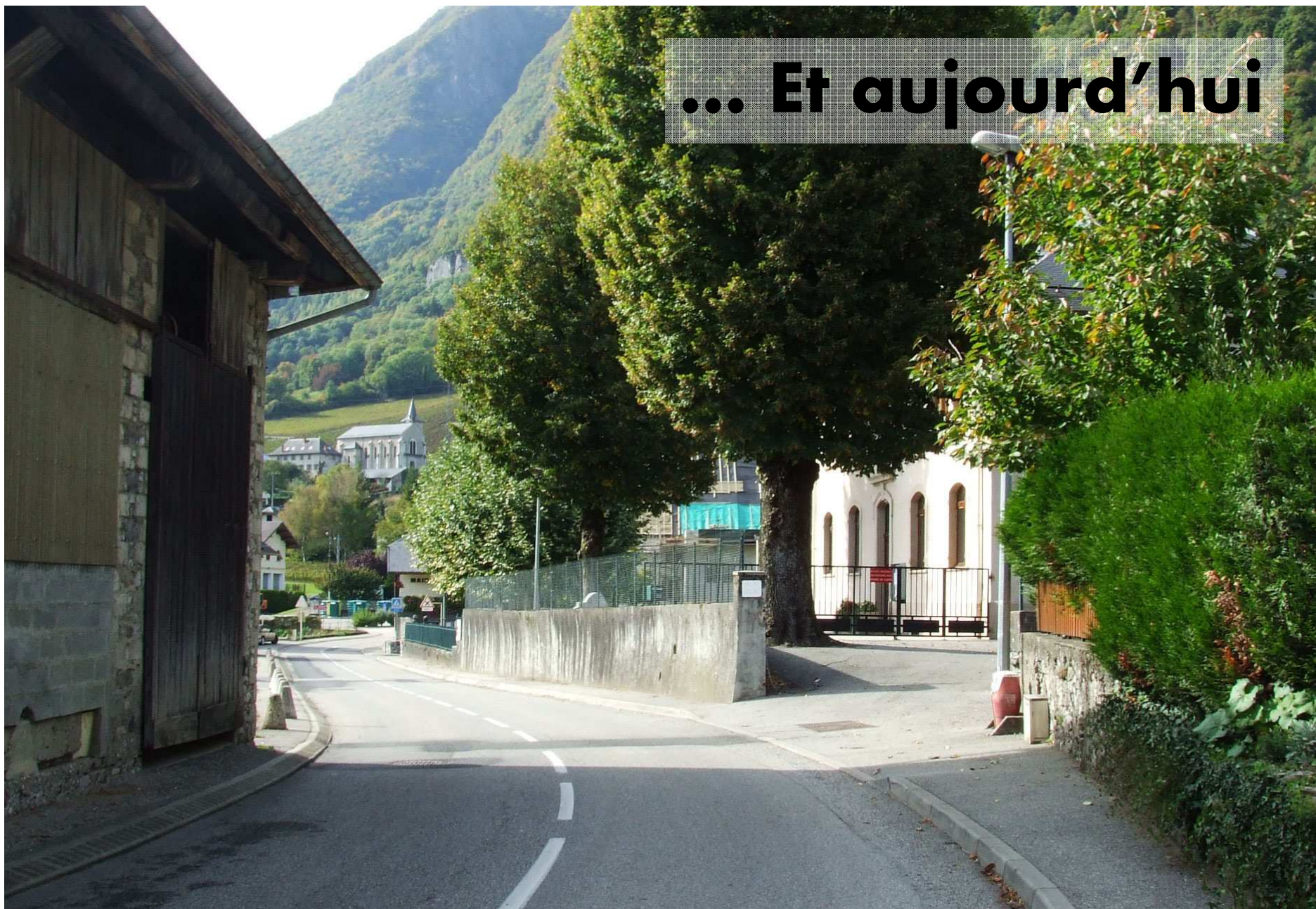
La vue devant l'école après agrandissement de la route et avec les constructions existantes aujourd'hui