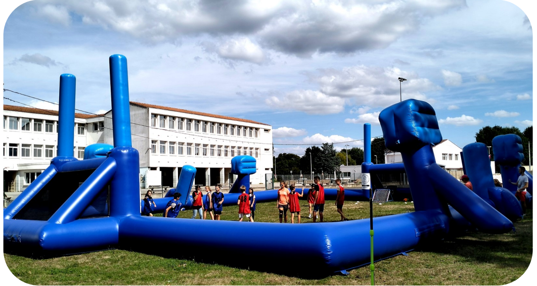
Animation sportive et ludique dans le cadre de Terre de Jeux 2024, le 26 août 2022

Madame le Maire reçoit sur rendez-vous les mercredis et samedis matins.