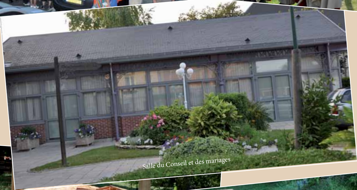
Salle du Conseil et des mariages