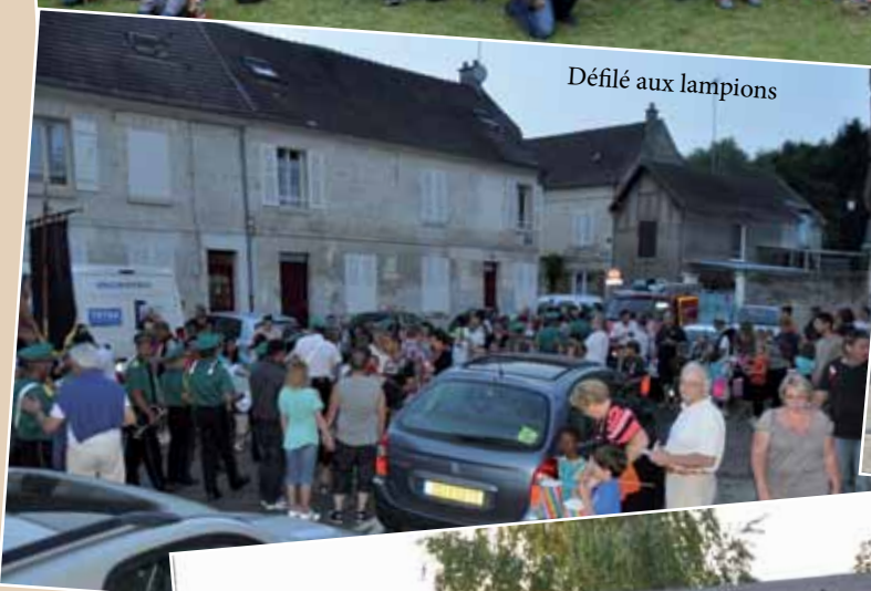
Défilé aux lampions