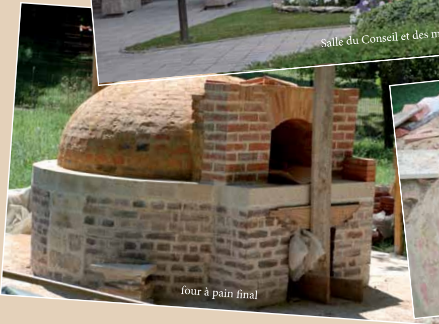
four à pain final