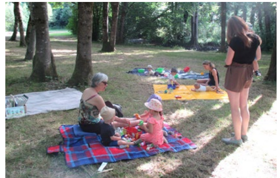
Matinee d'evail exterieure