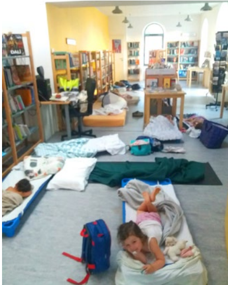
Une belle expérience pour tous !

Au programme : du bricolage, de la lecture et une nuit insolite entourés des livres !