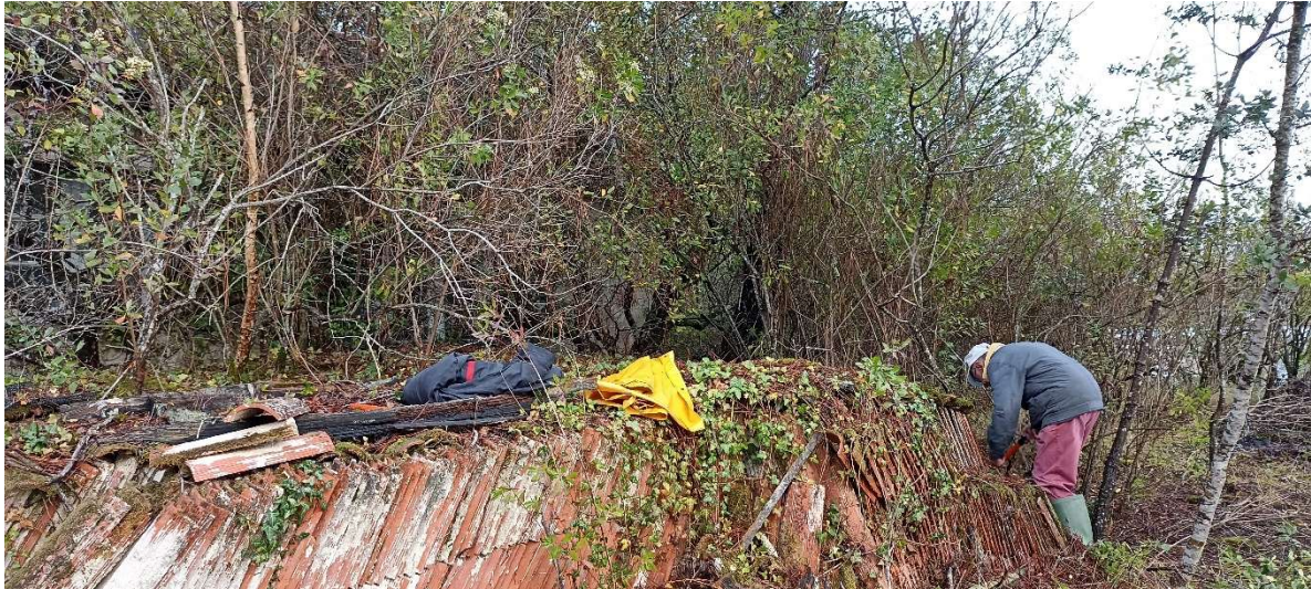
Mise à jour de tuiles ostréicoles en relativement bon état