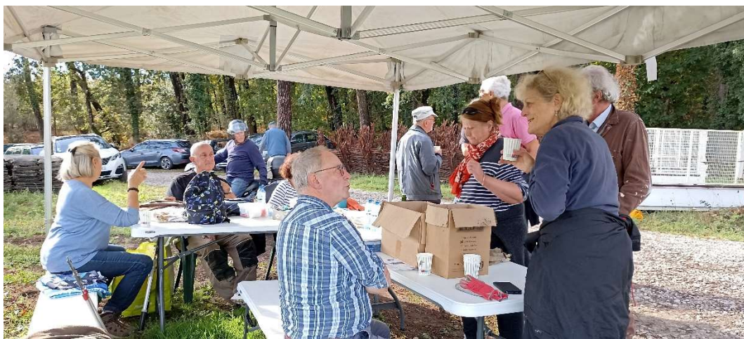
Moments d'échanges et de convivialité entre les participants des différentes associations