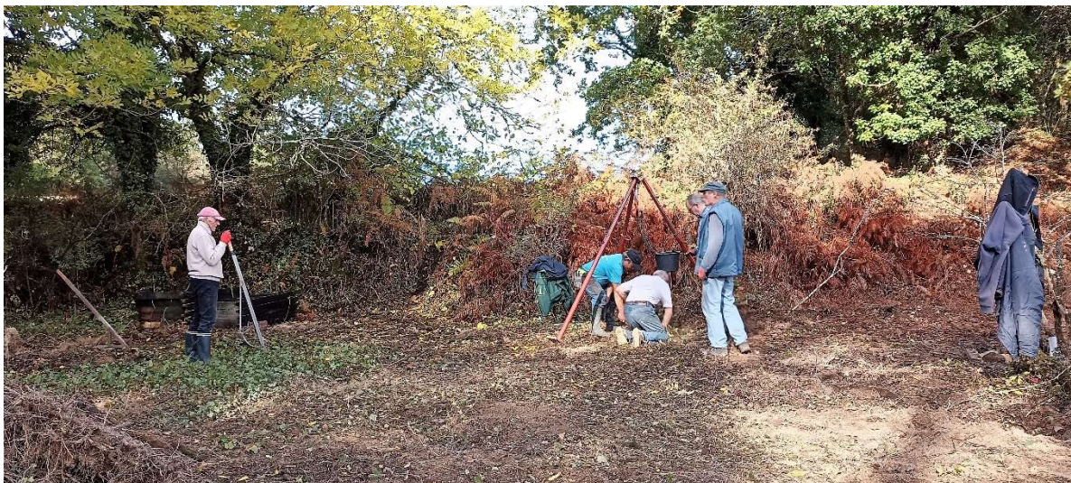
Pour éviter les rejets, les souches sont arrachées à l'aide d'un palan