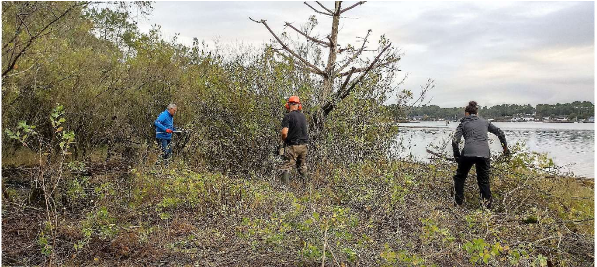
Les plants de Baccharis sont encore nombreux, denses et de grandes tailles sur la partie est du terre plein