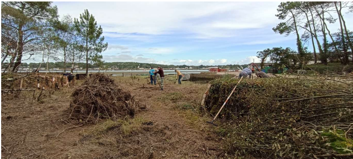
Les souches et les plants de baccharis sont laissés sur le terre-plein