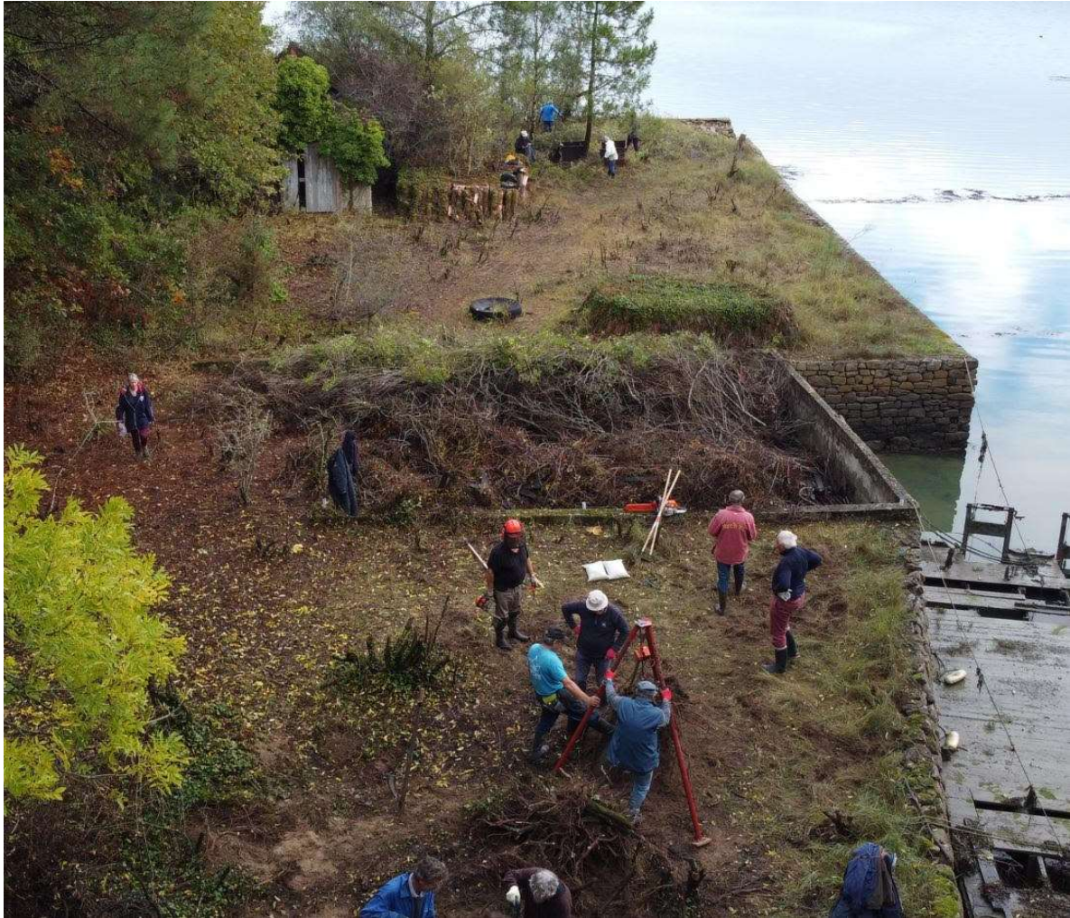
Les branches de baccharis coupées ont été entreposées dans un bassin vide au milieu des deux terre pleins