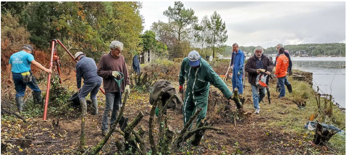
Après le précédent chantier, de nombreuses souches de baccharis sont présentes sur le terre-plein