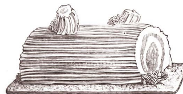
Bûche de Noël.

Recette facile et sans cuisson à réaliser avec les enfants !