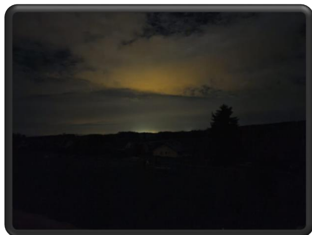
Photo prise par Bertrand Jehl à 5 H 26. Vue de notre village plongé dans le noir, contrastant avec les lumières de Bâle qui se reflètent dans les nuages...

Éteignons les éclairages la nuit et rallumons les étoiles.