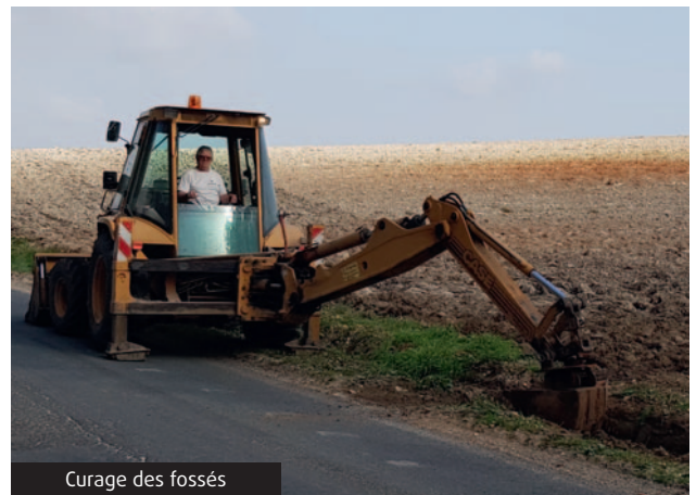
Curage des fossés

Avant l'arrivée des pluies, la municipalité a priorisé le curage des fossés pour éviter des débordements pouvant provoquer des inondations et mettre en péril les habitations et leurs occupants.