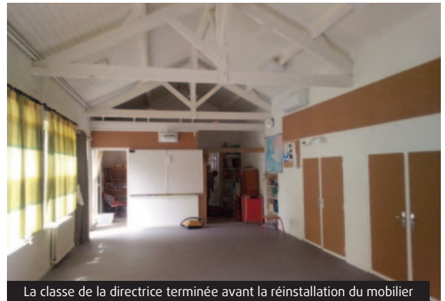
La classe de la directrice terminée avant la réinstallation du mobilier

Comme tous les étés, les agents des services techniques sont intervenus aux écoles. Cette année, à la demande de la directrice, les travaux ont été axés essentiellement sur sa classe. Pour donner de la clarté, les poutres ont été découpées et peintes en blanc, les plafonds et les murs également. De plus, les tableaux en liège ont bénéficié d'un rajeunissement. Afin d'effectuer des économies d'énergie, des éclairages LED ont été installés. La classe a également été équipée d'un vidéo projecteur interactif (VPI). Enfin, un nouveau revêtement de sol a parachevé cet embellissement. Les autres classes de l'école primaire et celles de la maternelle ont bénéficié d'un entretien courant et du branchement d'un nouveau VPI.