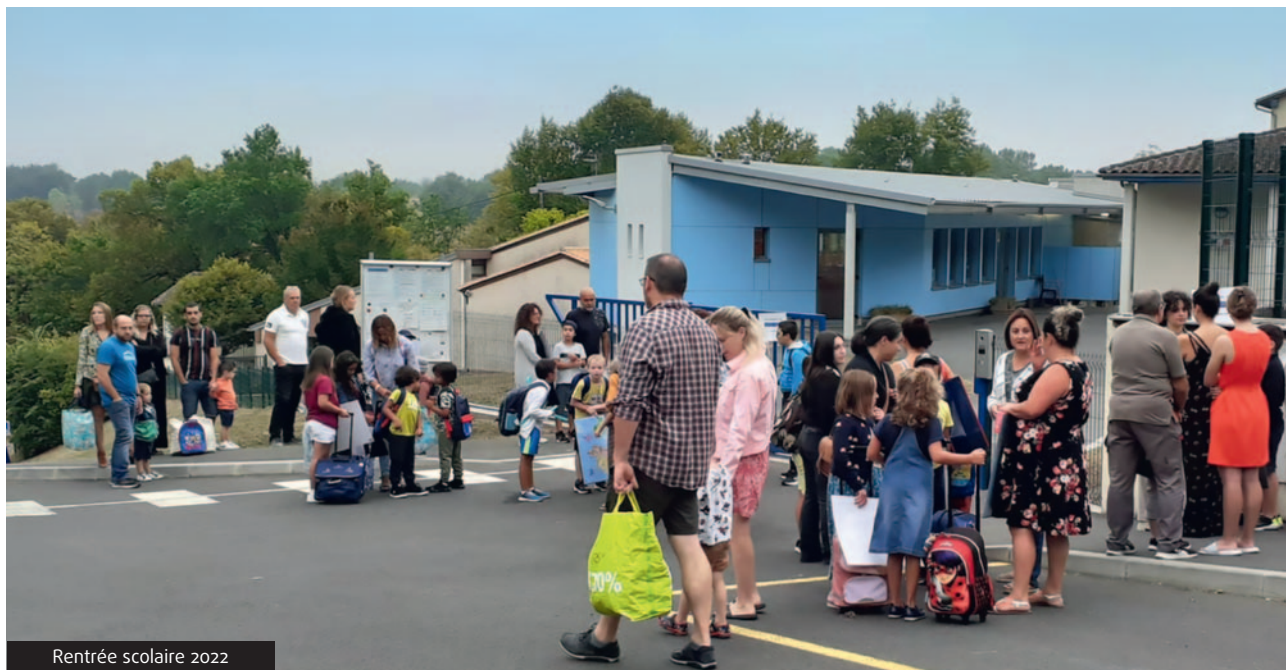
Rentrée scolaire 2022

L'école, c'est la vie d'un village et la municipalité de Coursac l'a compris depuis longtemps. A l'heure où certaines communes réduisent leurs lignes budgétaires affectées aux écoles, Coursac maintient et renforce son taux de participation pour le bien-être des 237 enfants scolarisés dans l'établissement communal. Petit retour et projections sur le budget 2022 attribué à l'école par la mairie.