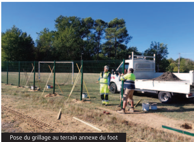
Pose du grillage au terrain annexe du foot

Pour protéger les enfants de la route et rassurer les entraîneurs et les parents, les agents communaux ont posé un grillage aux abords du terrain annexe de football. Désormais, les enfants ne seront plus tentés de récupérer le ballon sur la route !