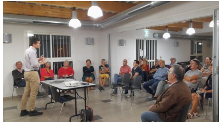
Réunion publique du 18 octobre

Vous êtes intéressé? Vous vous questionnez? Venez participer à la prochaine réunion le vendredi 25 novembre à 19h00 à la mairie de Saliès pour rejoindre la vingtaine de familles déjà prête à s'élancer.