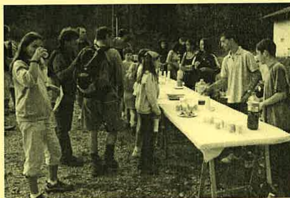
Les jeunes à la rando nature du 22 septembre : Une participation active et appréciée !