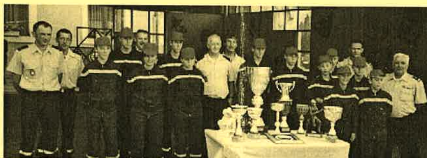
Nous pouvons être fiers de nos J.S.P.!

Tous ces résultats sont d'autant plus remarquables que la section est petite par son nombre d'adhérents, et que ses moyens matériels, humains et financiers sont modestes.