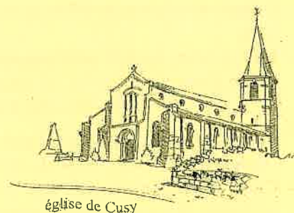
église de Cusy

Ces travaux, d'une durée de trois mois, débuteront après les fêtes de la Toussaint pendant lesquels l'édifice sera totalement fermé au public.