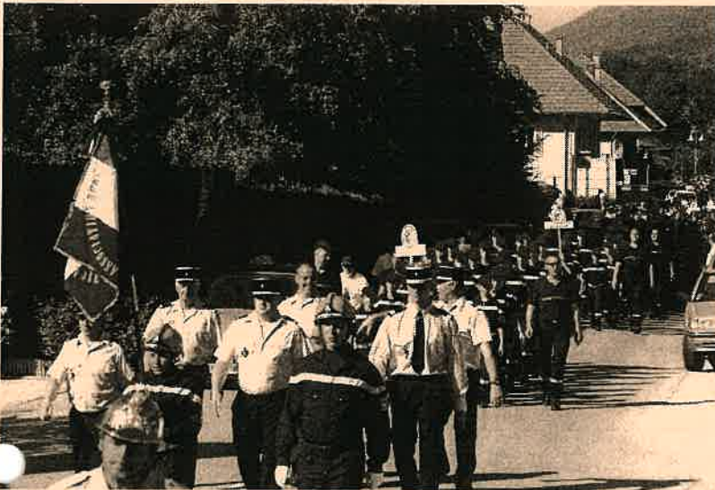
Défilé des 24 sections de Jeunes Sapeurs Pompiers dans le village de Cusy

La section voulait profiter de « Cusy Infos » pour remercier toutes les personnes qui ont aidé à l'organisation (Parents, Sapeurs Pompiers de Cusy, Rumilly, Saint Ours, l'UDSP 74, Extérieur), les commerçants et artisans pour leur générosité, les associations de Cusy pour le prêt de matériels, la municipalité de Cusy.