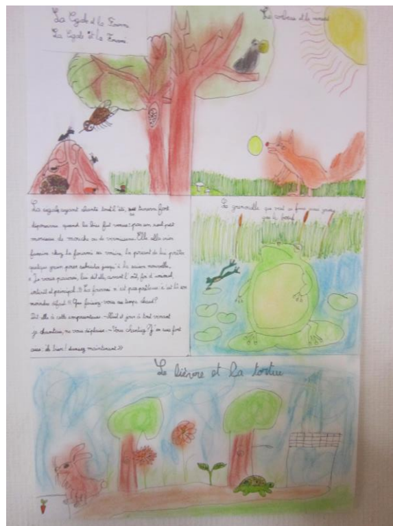
Photos 1 - belle réalisation de Samuel sur les fables de la Fontaine

MERCI AUX ENFANTS DE L'ECOLE POUR LEURS BEAUX DESSINS