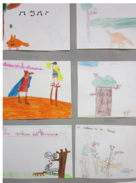
Photos 2 - fables de la Fontaine par les CP-CE1