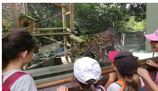
Une journée au zoo de St Martin la Plaine

Nous vous souhaitons, à vous et vos enfants, une belle année scolaire et vous disons à bientôt.