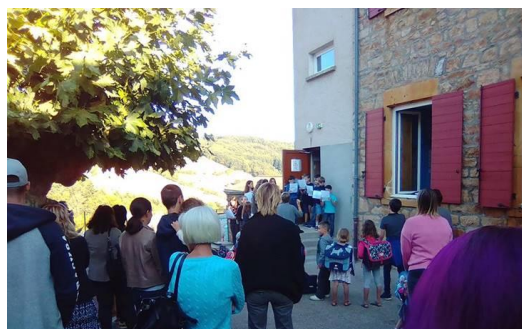
La rentrée 2018 en chanson !