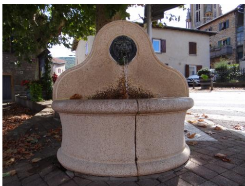
La fontaine coule à nouveau !