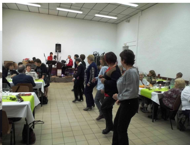
Démonstration de madison