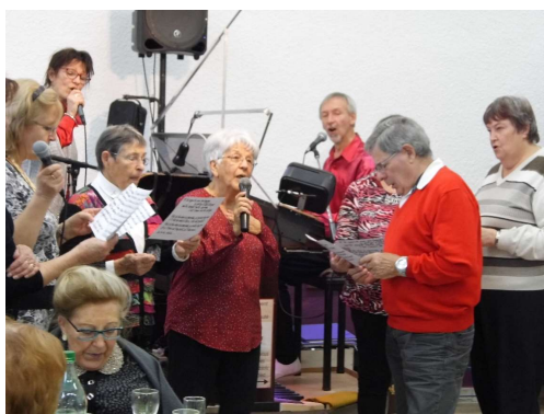
Le chœur improvisé

animation dynamique et joviale. Chacun a pu pousser sa chansonnette et un chœur improvisé a mis une ambiance de feu.