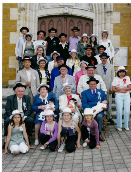
Les 7 en 2007

La journée se terminera par une soirée dansante ouverte à tous. Si vous êtes nés une année en 7, et que vous n'avez pas été contactés, faites-vous connaître en mairie, vous pourrez ainsi participer pleinement à cette fête.