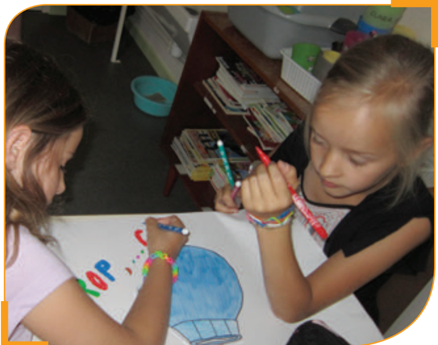
Kamishibai avec la classe Primaire

L'association du Patrimoine recherche des photos d'événements antérieurs à 1950 (photos d'école, photos de conscrits, de fêtes de village, de cérémonies, ...) pour une exposition pour la journée du Patrimoine 2015. ■