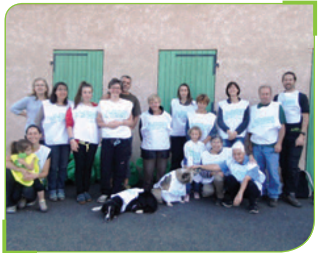
Nettoyons la nature