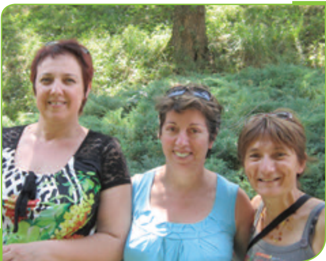
Trois dames des «5»