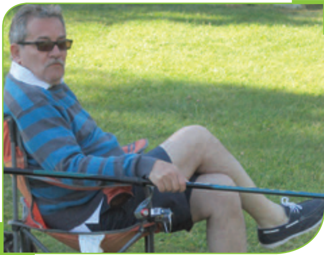
Vive la pêche