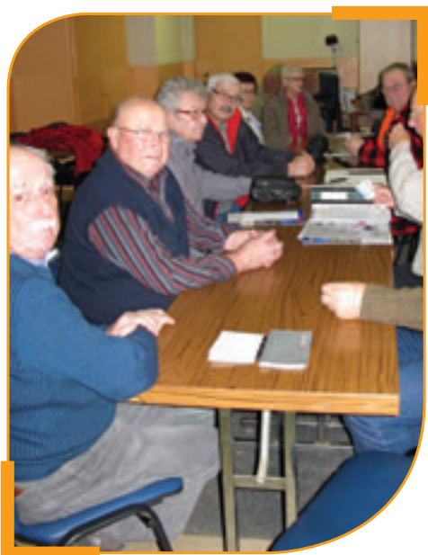
Assemblée générale 2014

(Anciens combattants Algérie, Tunisie, Maroc)