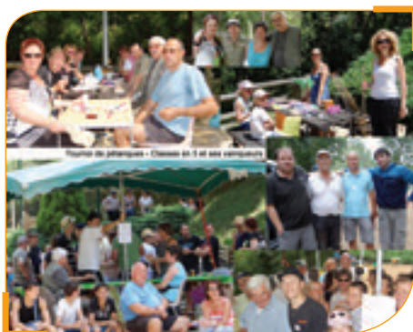
La pétanque des classes en 5

Dégustation de brioches et renouvellement du bureau.. ■