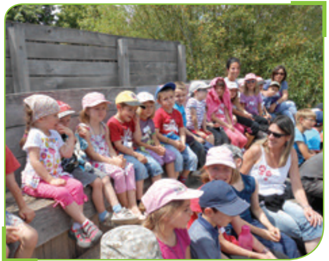
Voyage de l'école