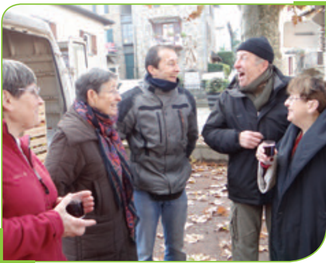
Les Classes en 5 se préparent