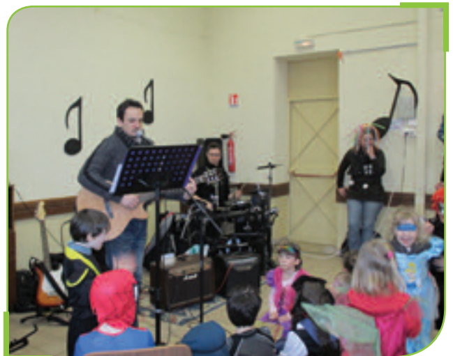
Vive la musique