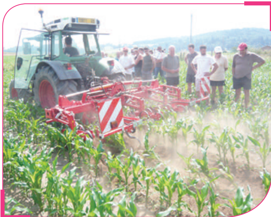
Essai de matériel (bineuse à maïs) par les agriculteurs

Concernant la thématique des inondations, depuis février 2014, des diagnostics de vulnérabilité pour les habitations sont proposés aux habitants (des zones rouges, bleues et vertes qui ont eu de l'eau lors des dernières inondations) de L'Arbresle et Sain Bel. Ces diagnostics permettent d'estimer les dégâts provoqués par une crue dans les habitations et de proposer des solutions pour les limiter. A ce jour, il y a une centaine de demandes de diagnostics sur ce