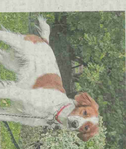
PACO. N°59. Mâle Épagneul, né le 26/09/19.