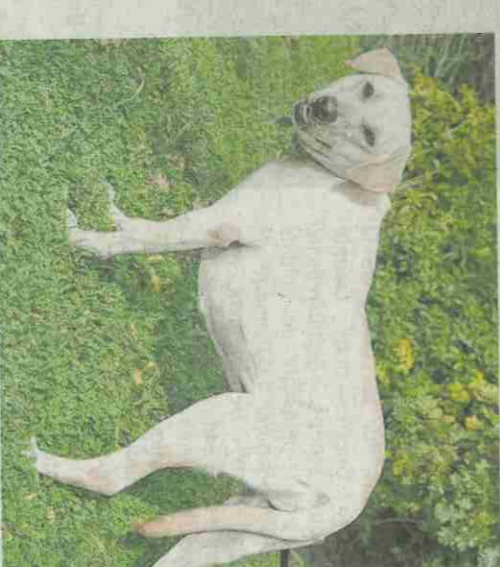
NICKY. N°3. Femelle Labrador, née le 03/06/21.