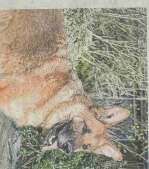
DULCE. N°37. Mâle Berger Allemand, né le 25/01/16.