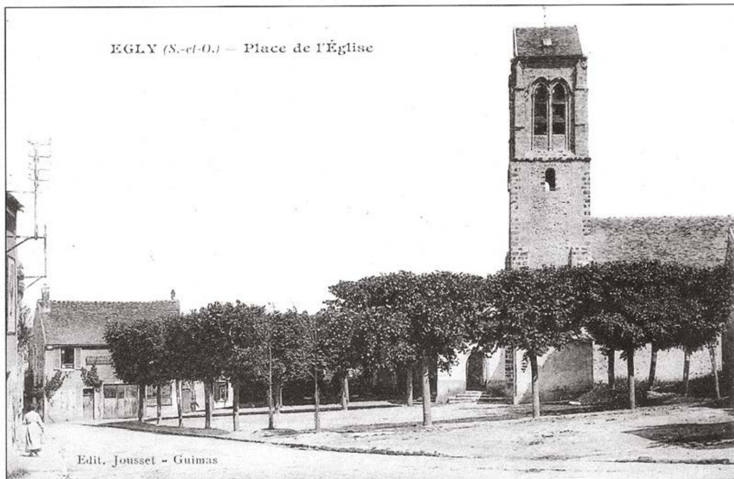
Le haut clocher de l'église Saint-Pierre-Saint-Paul date du XIII e siècle.