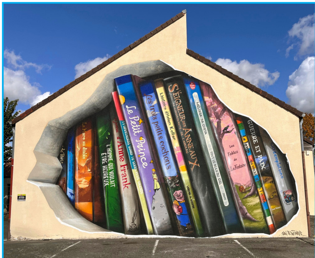
« Livres à découvrir » réalisée par JanIsDeMan le 07 octobre 2022 et financée par Grand Paris Sud