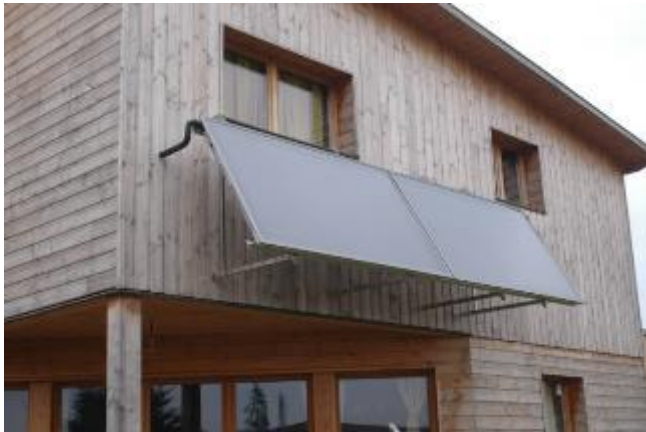
Chauffe-eau solaire obligatoire

Sensibilisation à l'isolation, chauffage, matériaux ... par le Forum de l'habitat sain