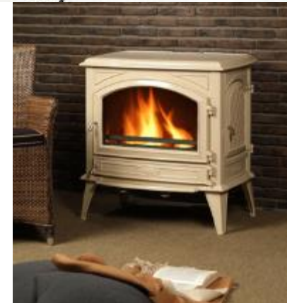
Poêles à bois