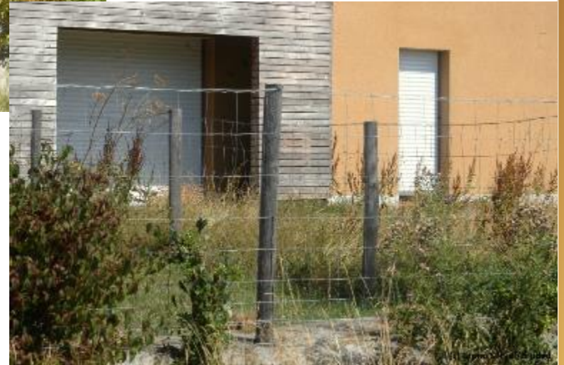
Clotures permettant le passage des espèces