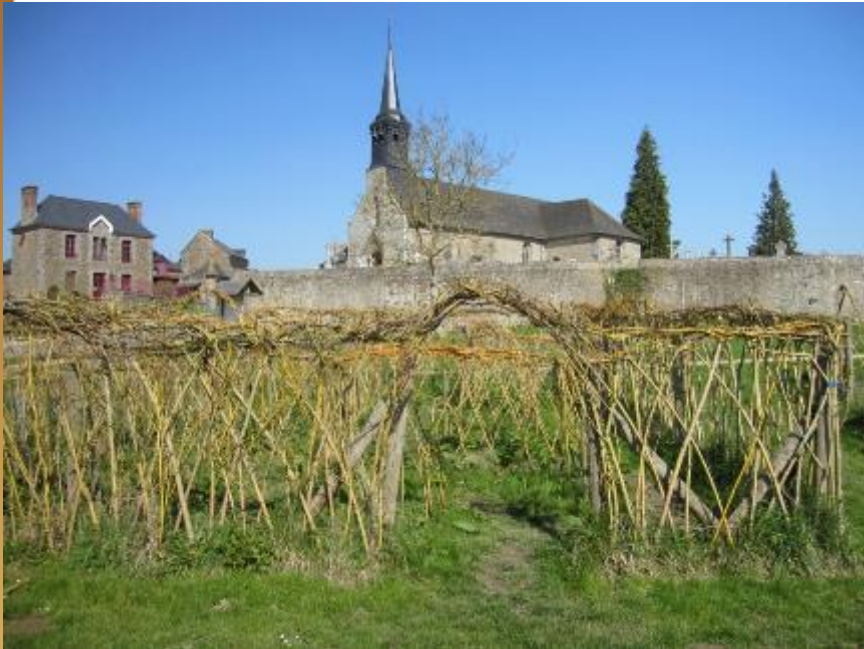
Labyrinthe en saule-tressé