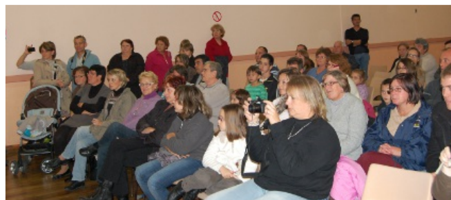
Aperçus du spectacle et du public