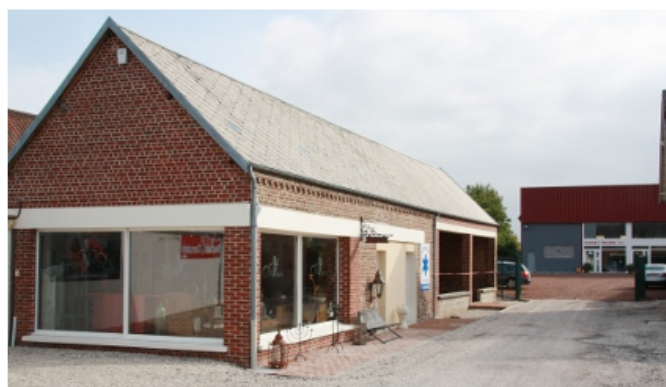
Vue d'ensemble du 85

À la suite des bureaux de Laféroise, on peut encore trouver un local disponible de 55 m 2 qui peut être aménagé suivant le projet de l'artisan ou commerçant qui voudra s'y installer.