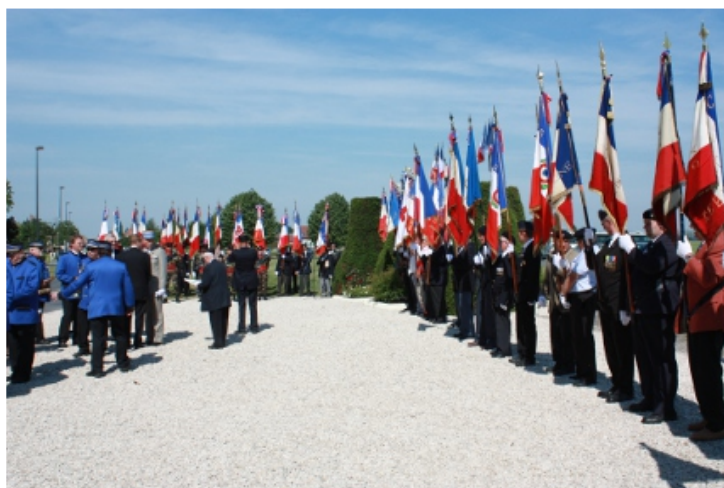
les porte-drapeaux et une partie de la foule

Sous un soleil éclatant, en présence de nombreuses personnalités, quelques anciens de la 2ème D.B., des anciens combattants ont commémoré le passage du Maréchal Leclerc à Flavy-le-Martel, dans la nuit du 3 au 4 juin 1940.