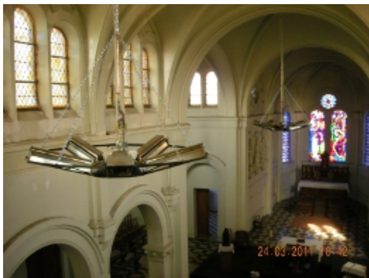
Le chauffage de l'église terminé courant novembre

La toiture de la mairie et de l'école du centre en cours