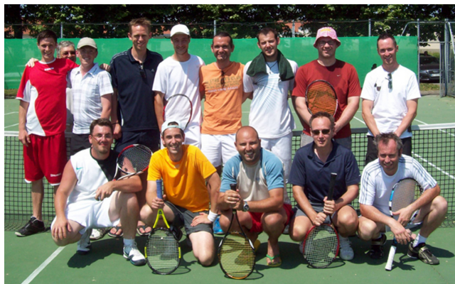
finale du championnat de l'Aisne