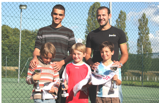
Jeunes champions de l'Aisne

Article réalisé à partir des données et photos du club.