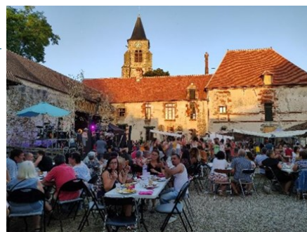
Groupe Pop Rock DO IT