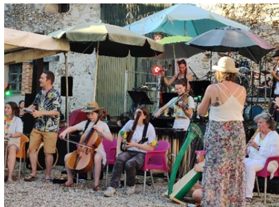
Apéro Swing Jazz Manouche CLswing Musiques traditionnelles du Brésil et Les Becots Da Lappa

La Commune a lancé un nouveau format de rencontre le 13 juillet intitulé "Live Music & Dance". Compte tenu du succès de cette opération, nous vous donnons rendez-vous en 2023.