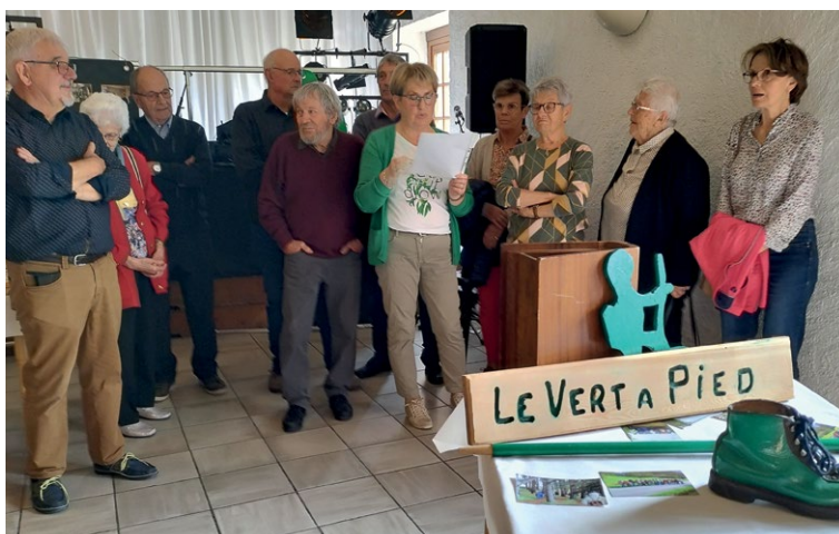
Quelques membres à l'origine de l'association il y a 40 ans.