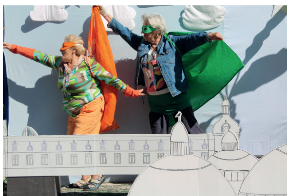
Les super bénévoles du Ruban Vert, héroïnes du quotidien (ici à la journée des associations)